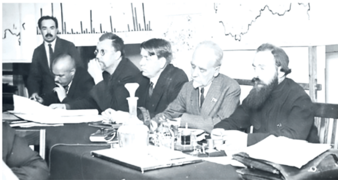
Заседание по плану ГОЭЛРО. Второй справа – Глеб Максимилианович Кржижановский, учёный-энергетик, академик и вице-президент Академии наук СССР

В основном это были бараки-общежития, бараки с комнатной системой и дома на одну, две и четыре квартиры. В посёлке имелись хлебопекарня, две столовые, магазины, рынок, сберкасса, школа, детские ясли, больница и амбулатория, рабочий клуб, партийный клуб и помещение для рабочих организаций. Всё необходимое для текущей жизнедеятельности и для будущего развития посёлка закладывалось сразу; многое – в расчёте на долговременное существование нового города на берегах Волхова, который мыслился и создавался как «образцовый социалистический город-сад». 19 декабря 1926 года Волховская ГЭС дала промышленный ток, а 12 августа 1927 года с вступлением в строй четырёх гидроагрегатов, изготовленных на Ленинградском