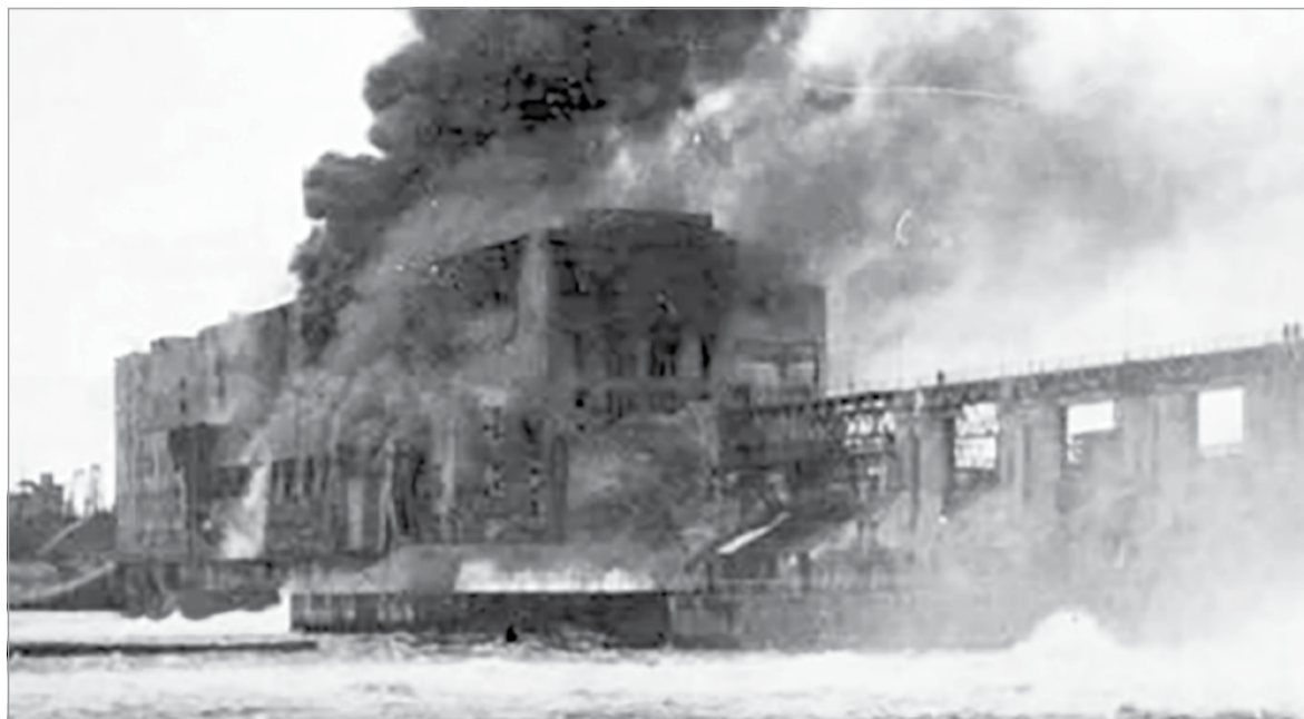
Пожар на Свирской ГЭС (1941 год)

– Историческая правда заключается в том, что Маннергейм, как один из главных политических и военных руководителей Финляндии, со стороны этой страны