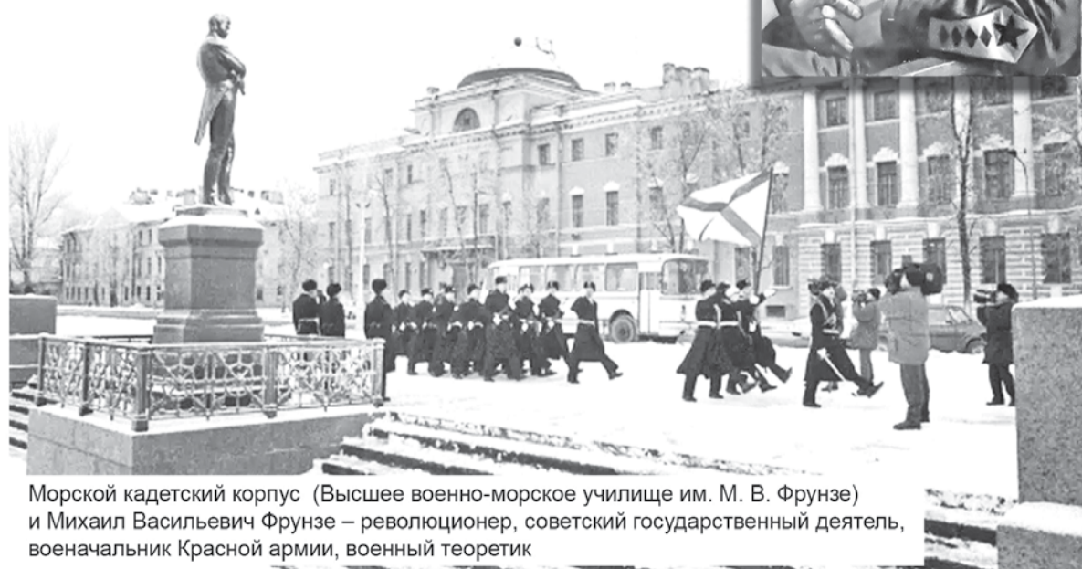
Морской кадетский корпус (Высшее военно-морское училище им. М. В. Фрунзе) и Михаил Васильевич Фрунзе – революционер, советский государственный деятель, военачальник Красной армии, военный теоретик