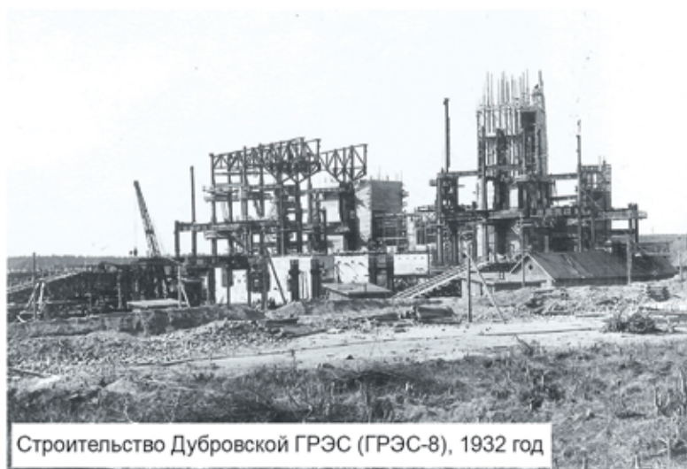
Строительство Дубровской ГРЭС (ГРЭС-8), 1932 год