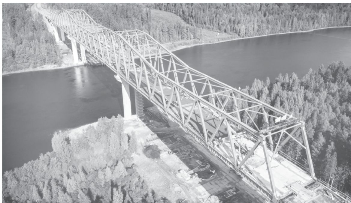
Строительство моста через Свирь идёт с применением технологии литого асфальта

– Подрядчик работает быстро, область и Минтранс договариваются о предоставлении федеральных субсидий, чтобы мосты строились ещё быстрее. Ориентир по запуску рабочего движения – следующий год. Если говорить о Подпорожье, то уже есть проект второй очереди моста со строительством тоннеля под железной дорогой и выводом транспорта на Мурманское шоссе в обход города.