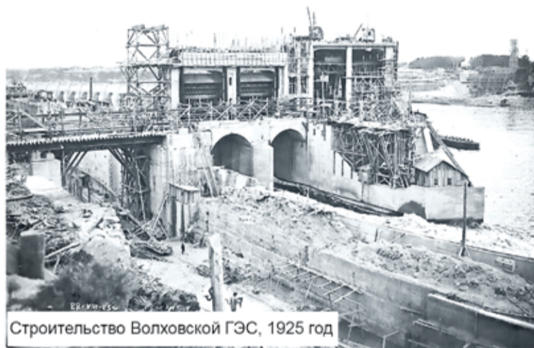
Строительство Волховской ГЭС, 1925 год

град в электроэнергии. Она являлась в то время самой мощной в стране и одна вырабатывала в пять раз больше энергии, чем все гидроэлектростанции дореволюционной России. Ещё более крупным объектом гидроэнергетики в рамках ГОЭЛРО стала Нижне-Свирская ГЭС. Проекты гидроэнергетического освоения Свири появились ещё в дореволюционные годы. В 1916 году инженер В. Д. Никольский рассчитал «запасы водной силы реки Свири» и предложил построить на Свири две электростанции и регулирующие плотины.