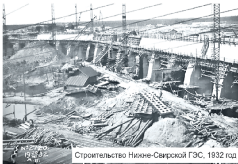
Строительство Нижне-Свирской ГЭС, 1932 год

Нижне-Свирская ГЭС стала для Ленинградской области первой ударной стройкой первой пятилетки. Поскольку впервые в ми-