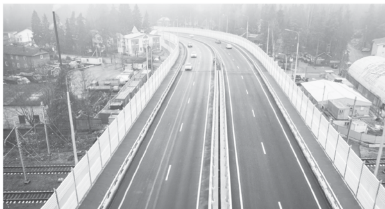
Тротуары на путепроводе во Всеволожске – в цветах города

Если говорить о следующих проектах, то их три. Первый – обход Мурино в створе Пискаревского проспекта. Трасса станет продолжением Пискаревского проспекта с выходом на Токсовское шоссе в районе посёлка Кузьмолово, минуя загруженный участок до-